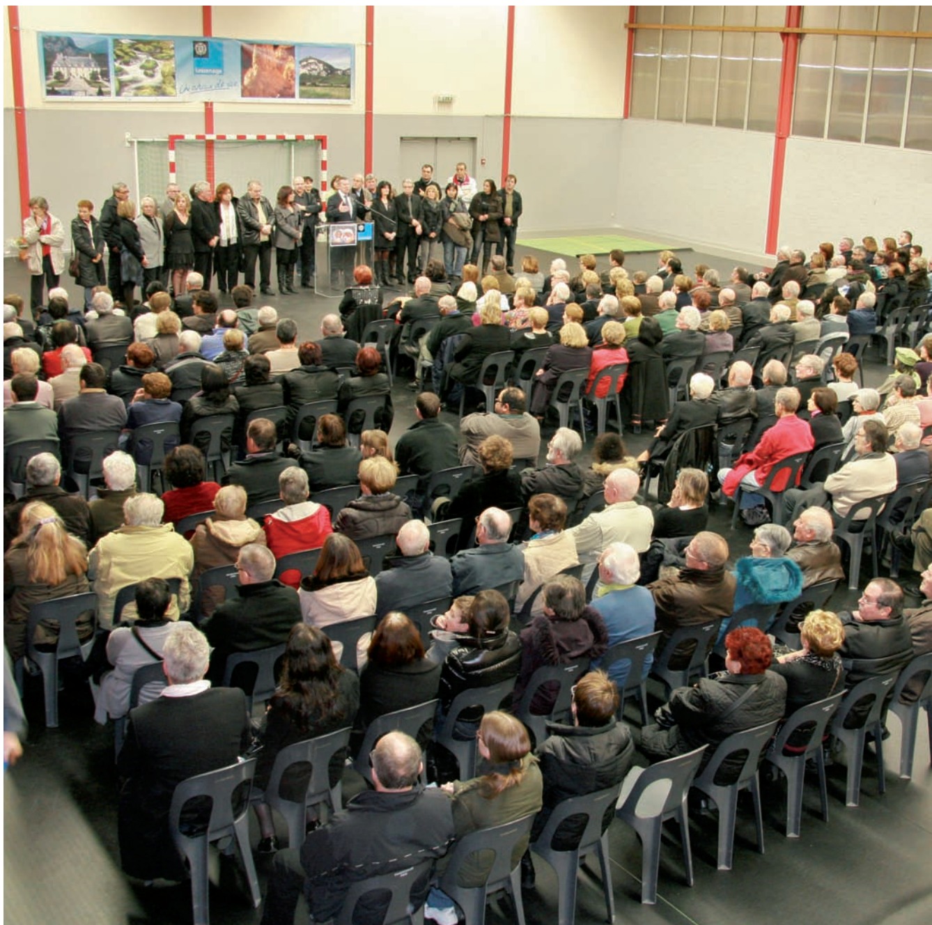
▲ La soirée des vœux est un moment important qui permet aux Sassenageois de mieux appréhender l'action municipale

S 'il est un rendez-vous important dans la vie d'une commune, c'est bien la présentation des vœux du maire à la population.