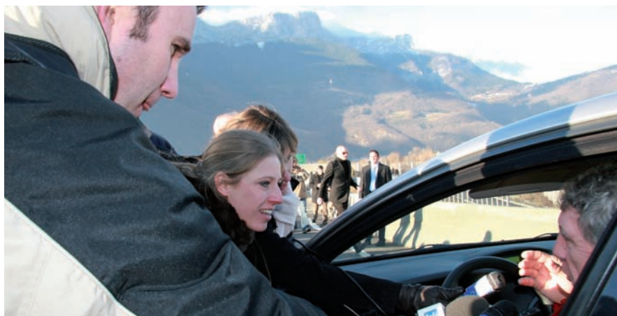
▲ Le premier riverain à franchir le pont-barrage en voiture a été pris d'assaut par les médias