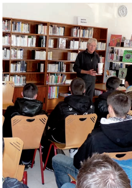
▲ Franck Pavloff rencontrait les élèves du lycée Roger Deschaux pour évoquer son dernier livre étudié en cours

« M atin brun » de Franck Pavloff est une nouvelle qui raconte l'histoire d'un homme ordinaire qui subit la montée d'un régime politique extrême, totalitaire. Facile à lire, ce court récit nous renvoie à des faits passés de l'Histoire, et ouvre la voie à la réflexion et au débat sur les dérives d'un système autoritaire. C'est précisément dans ce but que les élèves (1) du lycée technique Roger Deschaux rencontraient lundi 29 novembre l'auteur de ce livre qu'ils ont étudié au préalable en cours de français. Motivés et fiers de partager un moment avec un écrivain célèbre, les lycéens ont partagé leur vision sur les faits de l'Histoire suggérés par le livre, et ont abordé également des sujets d'actualité tels que la situation des Roms, ou les sans-papier.