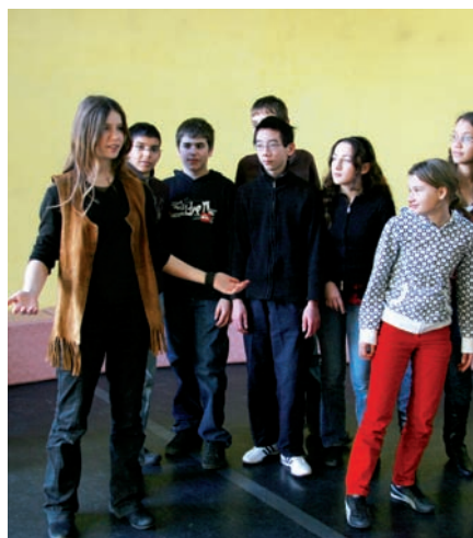
▲ Les RaTsConteurs à la médiathèque

La médiathèque, soucieuse de rendre accessible la lecture aux plus âgés et de favoriser les échanges intergénérationnels, proposera en juin 2011, et pour la troisième année consécutive, une séance de lecture de contes orchestrée par les RaTsConTeurs, un groupe d'enfants conteurs créé à l'initiative de la médiathèque et en partenariat avec l'association la CITé.