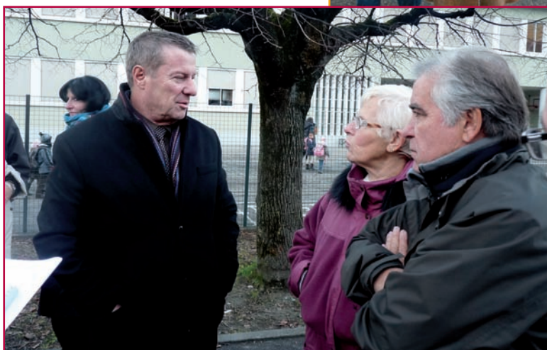
▲ Secteur Centre