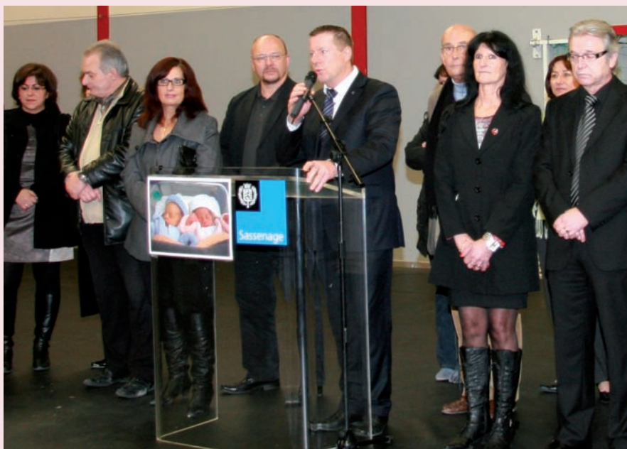
▲ Message clair et « parler vrai »