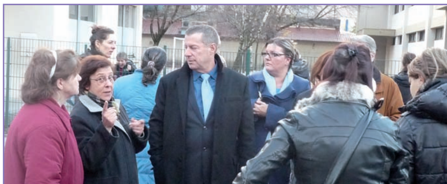
▲ Secteur Sud

L undi 29 novembre , tout se passe devant l'école du Furon côté Guâ pour évoquer les nouveaux trottoirs de la rue du Plaçage, les autos mal garées, la pose d'une barrière à l'intersection de l'avenue de Valence et du chemin de la Rollandière, ou encore la nécessité de distributeurs de sacs pour déjections canines.