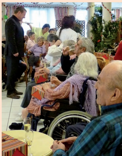
▲ Lors de la distribution des colis de Noël

Le but de la nouvelle équipe est d'ouvrir l'établissement sur la ville. Ainsi, de nouveaux partenariats devraient être créés ou renforcés avec les services ou