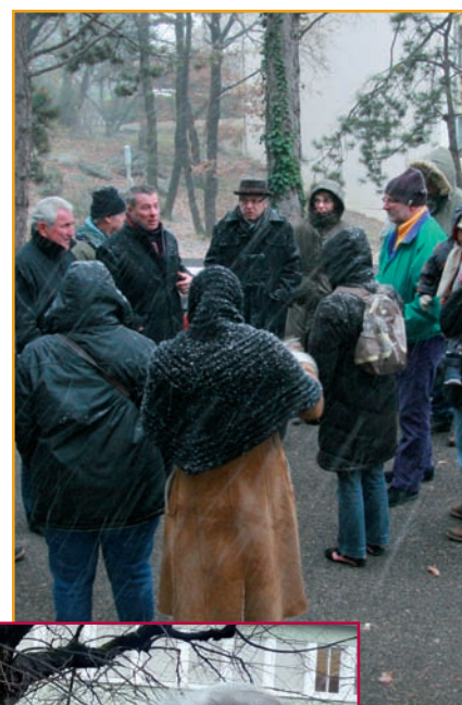
▼ Secteur Haut

Enfin, m ardi 30 novembre , à l'école Rivoire de la Dame, les Sassenageois présents ont bien du mérite car il neige abondamment. Qu'à cela ne tienne ! Le maire et les élus sont sollicités pour des réfections de trottoir et voirie, questionnés sur le déneigement, la création d'un chemin entre les Côtes et l'école, ou encore celle d'un arrêt de car scolaire supplémentaire au niveau du lotissement Terrasses de Sornin. Sans oublier bien évidemment les questions envoyées sur papier directement en mairie, par les personnes ne pouvant pas se déplacer lors de ces rendez-vous. Autant d'éléments qui feront l'objet de réponses dans les prochains numéros de Sassenage en pages... ■