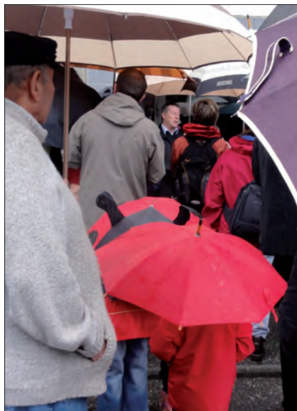
▲ De nombreuses questions ont été posées au maire et aux élus présents...