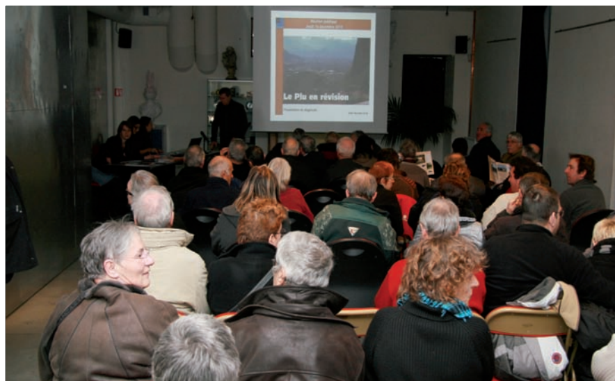
▲ Les riverains sont venus nombreux pour entamer le débat sur la révision du Plu

Ce 16 décembre, l'espace Henriette Gröll était plein à craquer de Sassenageois venus écouter les arguments de l'édile et poser des questions. Le débat portait principalement sur les transports et le logement, déviant naturellement sur les nombreux terrains agricoles présents sur le territoire. « Je reçois un ou deux agriculteurs par an souhaitant s'installer