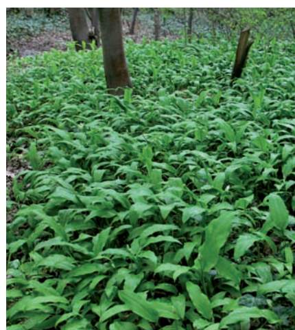
▲ Le marais des Engenières est une zone humide dont la préservation est indispensable