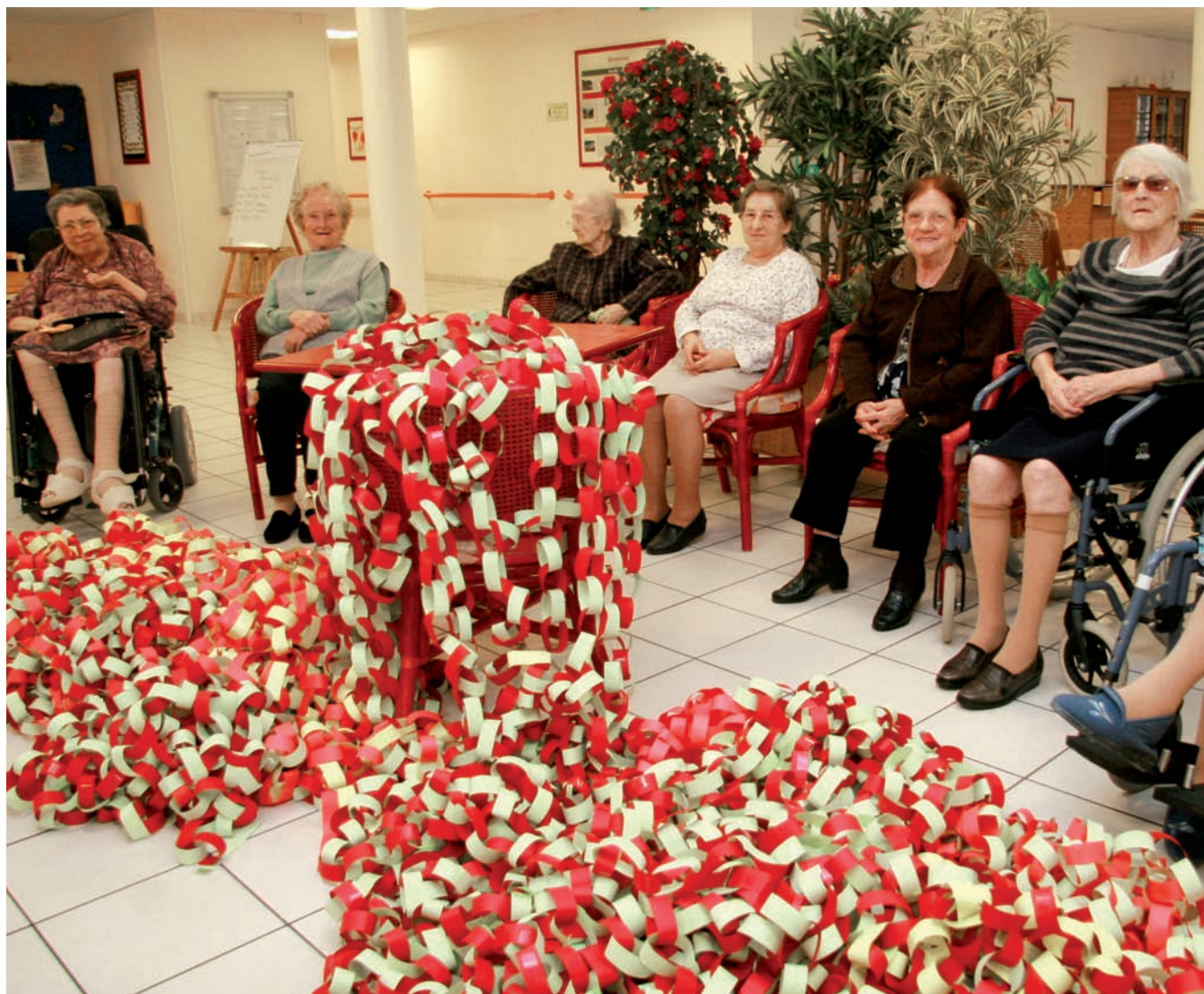
▲ Les résidents de l'éhpad ont confectionné une immense guirlande qu'ils étaient fiers de montrer et d'exposer

E n 2050, en supposant que la tendance démographique actuelle se maintienne, la France comptera soixante-treize millions d'habitants, et les statistiques sont formelles : un habitant sur trois sera âgé de plus de soixante ans. A Sassenage, les seniors de plus de soixante-cinq ans représentent actuellement 13,5 % de la population.