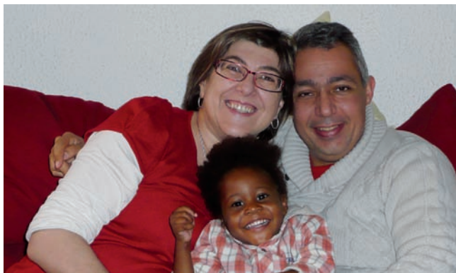
▲ Un bonheur enfin partagé