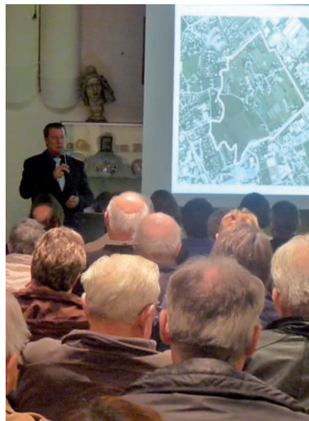
▲ Des riverains attentifs aux propos du maire

« Portes du Vercors » est un projet ambitieux, et beaucoup de questions restent en suspens. Une réunion publique était donc organisée lundi 15 novembre afin d'informer les propriétaires impactés sur leurs terrains, de l'avancement du dossier.