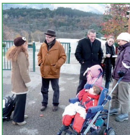
▲ Secteur Nord

V end redi 26 novembre , c'est devant l'école du Hameau du Château que les élus retrouvent les Sassenageois qui ont bravé le froid pour aborder des questions concernant le vélobus, les trottoirs de la rue des Grands Champs qui n'ont pas été refaits par La Métro, la pose de merlon en lieu et place de la bâtisse située avenue de Valence qui protégeait du bruit les riverains proches, le problème d'harmonisation des clôtures.