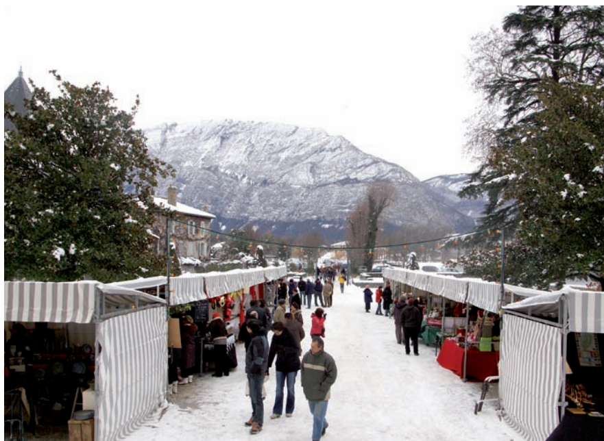
▲ Tout s'annonçait bien pour ce 10 ème Marché de Noël