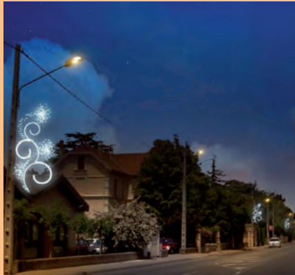
▲ Avenue de Valence