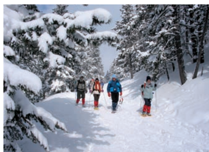
▲ La randonnée en raquettes est idéal pour découvrir la nature de manière respectueuse

L'hiver, la neige et les basses températures obligent la faune et la végétation à s'adapter pour survivre, parfois de façon étonnante. Les raquettes permettront de visiter cette nature dans le plus grand respect. Si vous n'en avez pas, le Sipavag