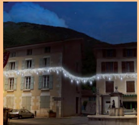
▲ Place Reverdy