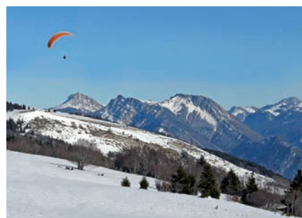
▲ Du plateau du Sornin, vue sur les massifs de Belledonne et de Chartreuse

Rendez-vous à 9h devant le Château de Sassenage, retour vers 16h30 Longueur : 8 km Dénivelé : 700 m