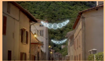
▲ Rue de la République

Vitrine de la commune, les entrées de ville feront l'objet d'une attention particulière : les quatre — avenue de Romans au sud, avenue de Valence au nord, route de Villard de Lans et carrefour des Martyrs — seront en effet dotées de motifs sur mâts, tout comme l'axe principal, à savoir les avenues de Romans et Valence. Ce même principe de motifs a été adopté pour le carrefour de Clémencière, le rond-point Jean Prévost, les places Charles de Gaulle et de la Libération, et la rue de la République, pour accompagner le visiteur dans le Bourg. Sur la place Reverdy, mais aussi sur l'église Notre-Dame des Vignes, aux Côtes, c'est un système de guirlandes stalactites qui magnifiera les lieux. D'autres, enfin, habilleront les arbres de la place de l'Europe. Un spectacle à admirer sans modération dès le 5 décembre, et jusqu'au 7 janvier. ■