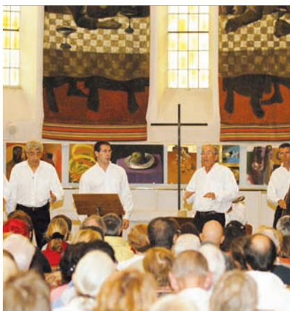
Les « Riverside Singers », vendredi 4 février à 20h30, entrée 12 €. Infos et réservations : 06 86 67 44 98 ou lesamisduchateau@orange.fr

Les « Riverside Singers » ne sont ni américains, ni noirs. Ils sont originaires du bassin grenoblois mais surtout ce sont des chanteurs amateurs qui nous font partager leur joie et leur passion. Un style qui se veut fortement inspiré des « jubilee groups » des années trente, notamment le Golden Gate Quartet. Leurs thèmes sont inspirés par le Negro Spiritual — des chants pleins d'espoir et de ferveur religieuse du temps de l'esclavage des Noirs vers les Etats-Unis — ou encore le gospel et le jazz-swing. Un répertoire varié qui ravira un grand nombre de spectateurs. Par leur prestation, les « Riverside Singers » font renaître un message de joie, de foi, de révolte et d'espoir, une soirée qui s'annonce riche en émotion. Réservez vos places dès à présent ! ■