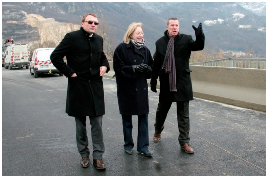
▲ Les maires de Sassenage, Noyarey et Saint-Egrève réclament des aménagements supplémentaires au pont-barrage

En attendant que les autres projets intéressants les déplacements n'aboutissent, et après presque vingt ans à s'être fait désirer, l'ouverture du pont-barrage était enfin officialisée le 13 décembre par le conseil général. Une surprenante inauguration d'ailleurs : deux bus remplis de personnalités faisant le tour de l'infrastructure, d'une rive à l'autre, en passant et repassant devant les badauds sans plus d'égard ni échanges, des cadeaux de bienvenue pour les seuls tout premiers automobilistes empruntant le