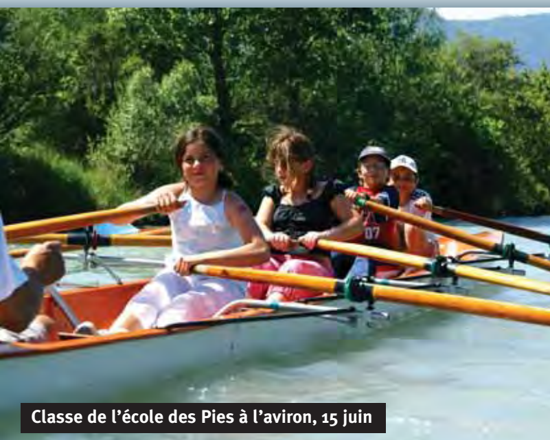
Classe de l'école des Pies à l'aviron, 15 juin