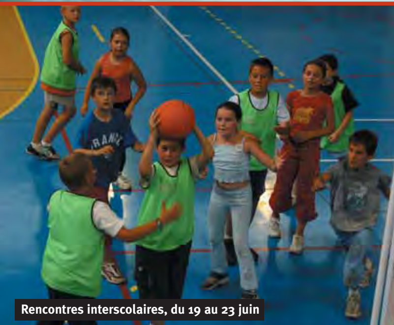
Rencontres interscolaires, du 19 au 23 juin