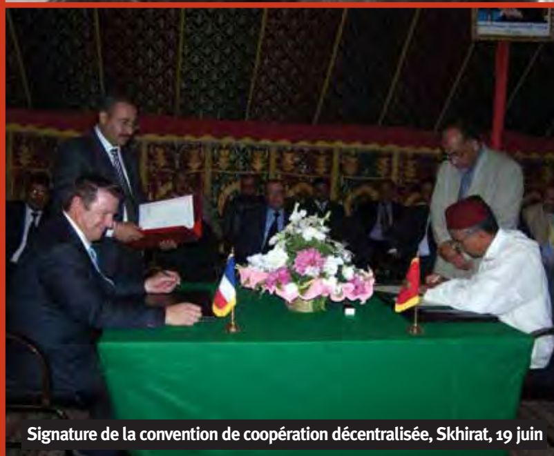
Signature de la convention de coopération décentralisée, Skhirat, 19 juin