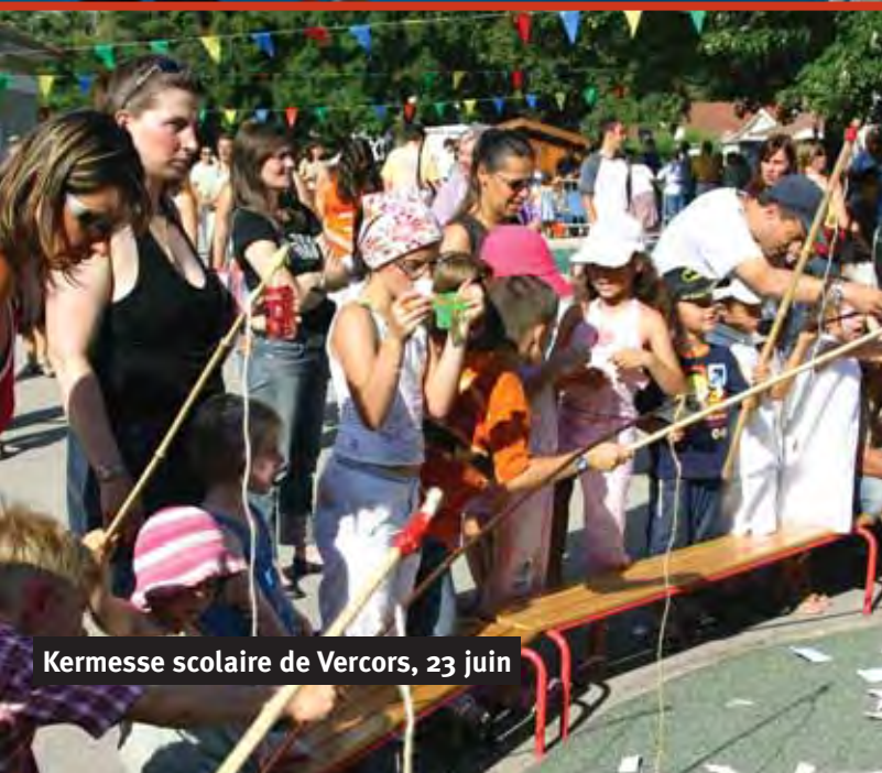
Kermesse scolaire de Vercors, 23 juin