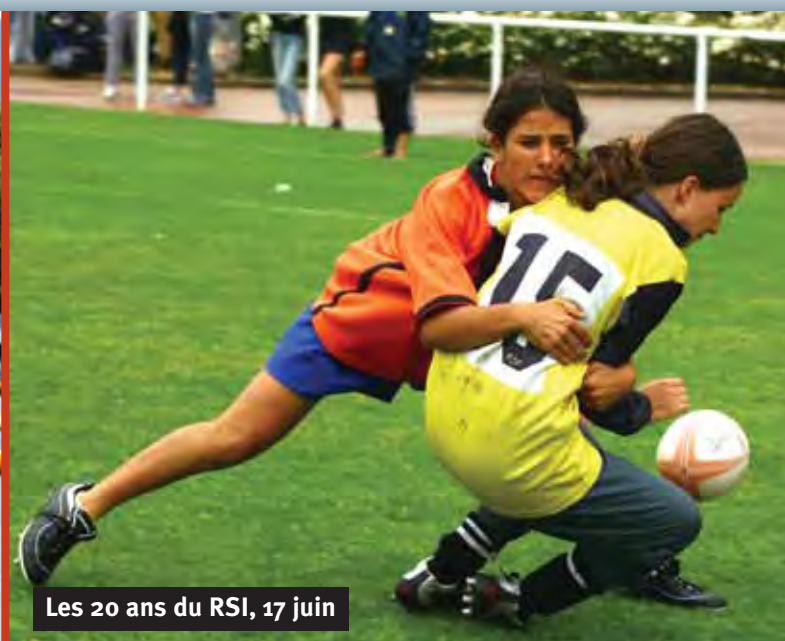
Les 20 ans du RSI, 17 juin