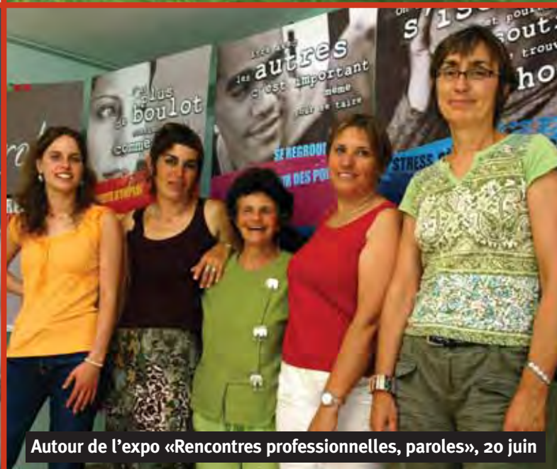
Autour de l'expo «Rencontres professionnelles, paroles», 20 juin