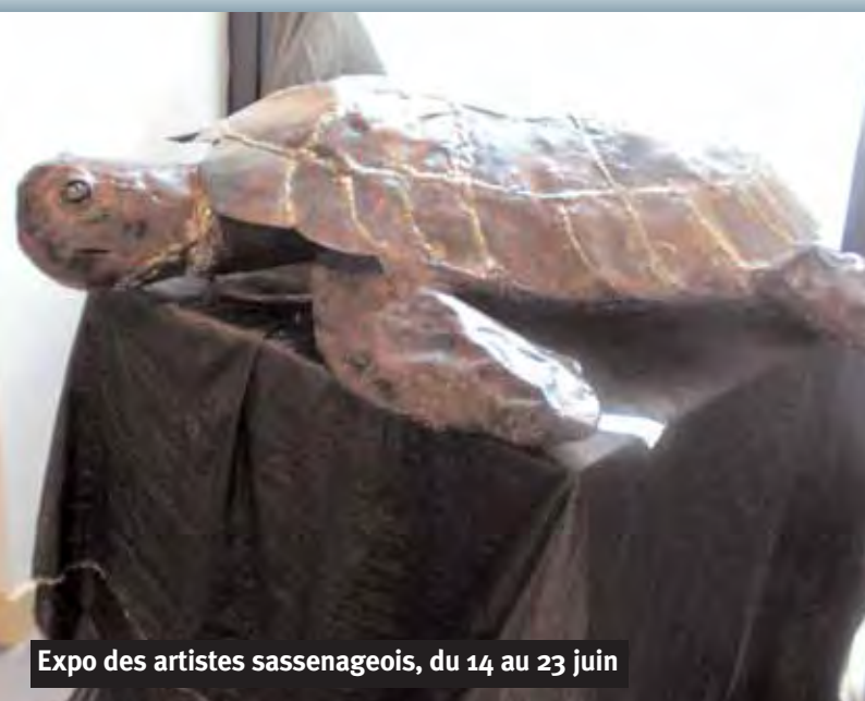
Expo des artistes sassenageois, du 14 au 23 juin