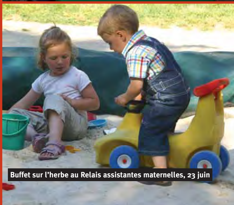
Buffet sur l'herbe au Relais assistantes maternelles, 23 juin