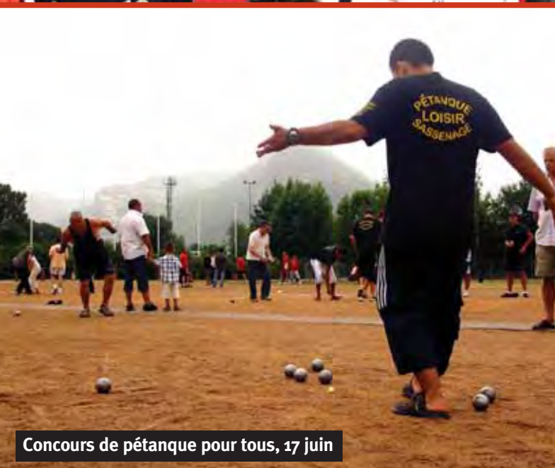
Concours de pétanque pour tous, 17 juin