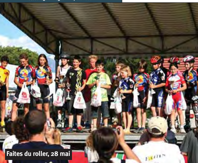
Faites du roller, 28 mai