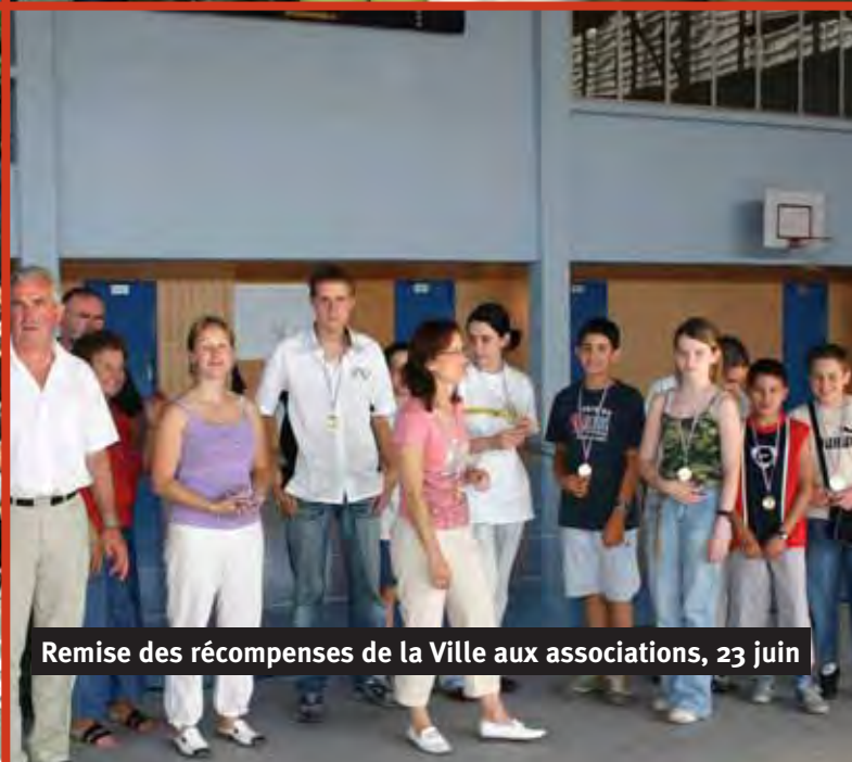
Remise des récompenses de la Ville aux associations, 23 juin