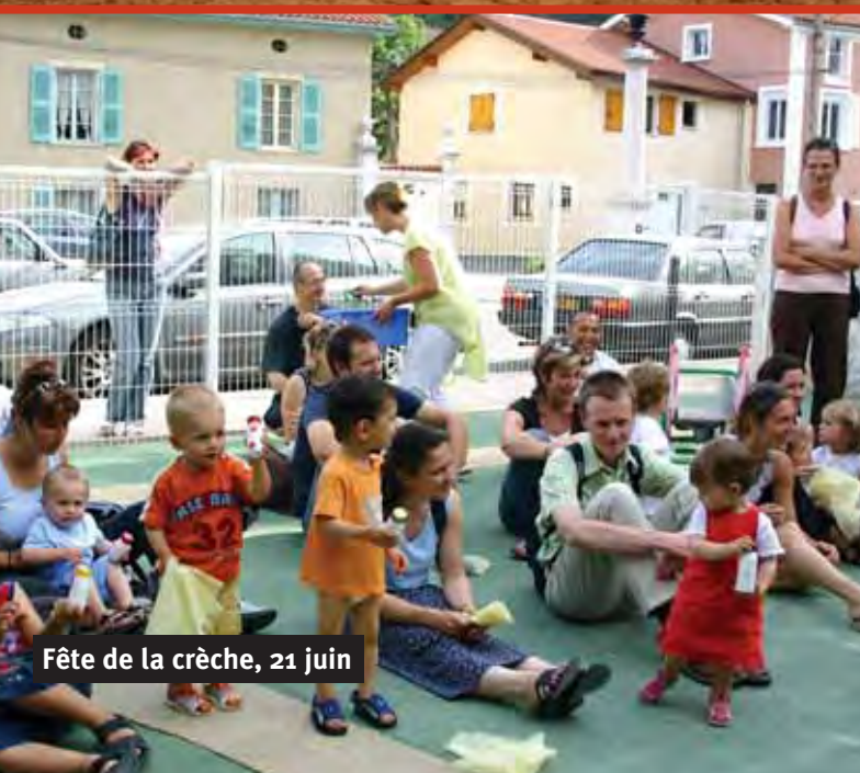
Fête de la crèche, 21 juin