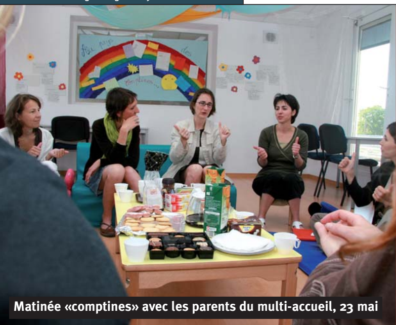
Matinée «comptines» avec les parents du multi-accueil, 23 mai