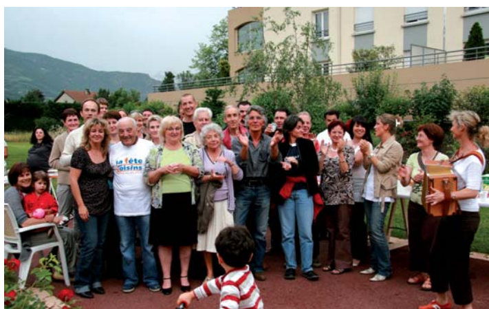
Domaine de la Petite Saône