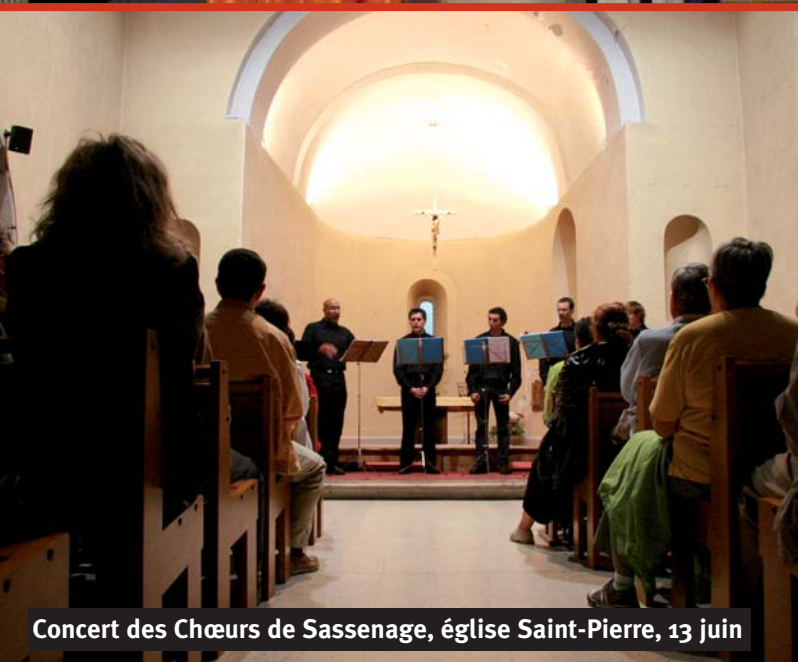
Concert des Chœurs de Sassenage, église Saint-Pierre, 13 juin