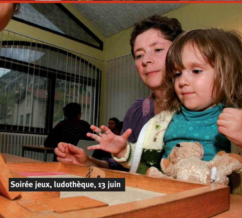
Soirée jeux, ludothèque, 13 juin