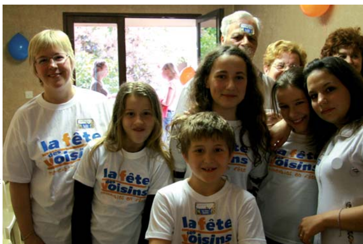
Résidence du Parc