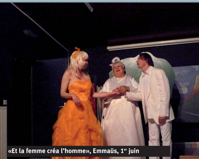
«Et la femme créa l'homme», Emmaüs, 1 er juin