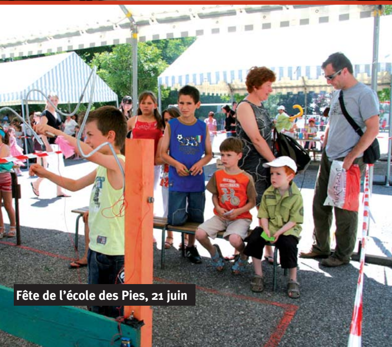
Fête de l'école des Pies, 21 juin