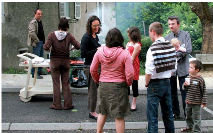
Rue du Vercors