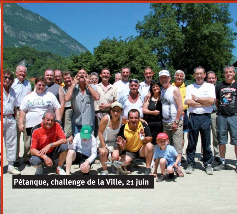
Pétanque, challenge de la Ville, 21 juin