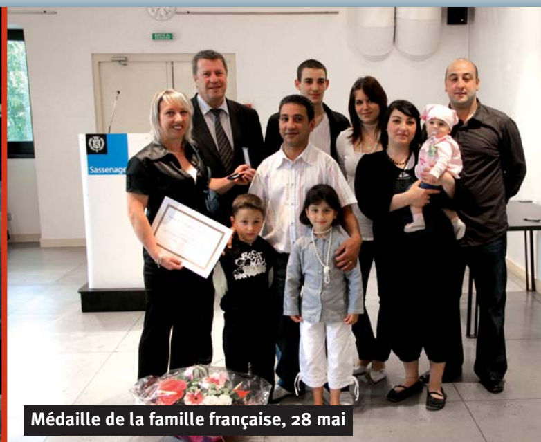
Médaille de la famille française, 28 mai