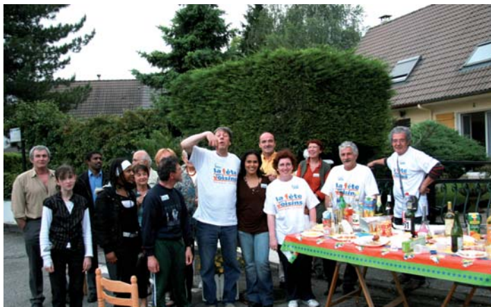
Lotissement La Saulée