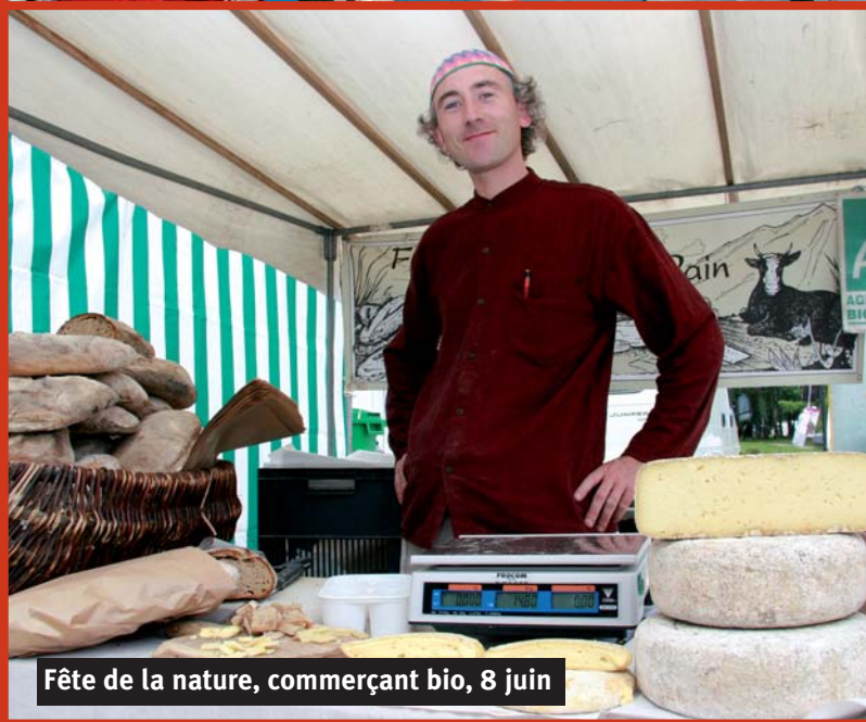
Fête de la nature, commerçant bio, 8 juin