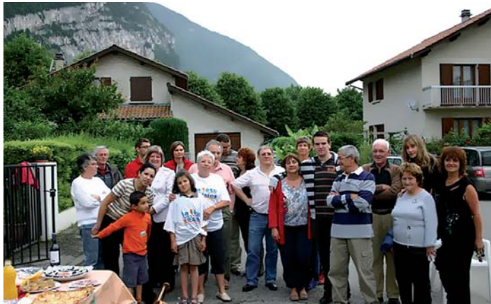
Rue Fontaine de la Roche