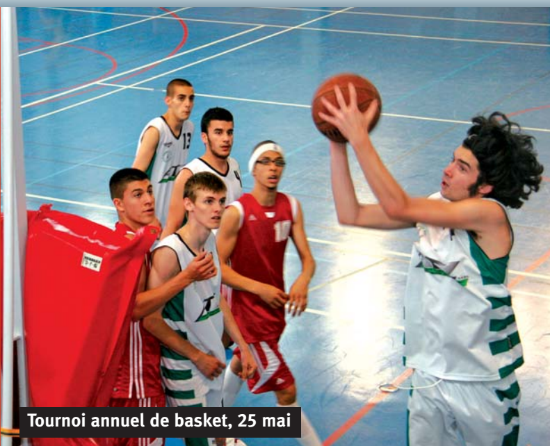
Tournoi annuel de basket, 25 mai