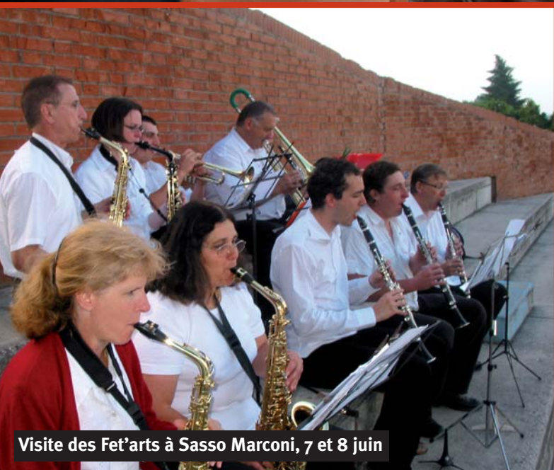
Visite des Fet'arts à Sasso Marconi, 7 et 8 juin