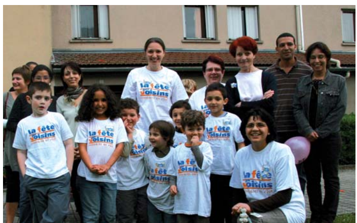
SDH à l'Ovalie