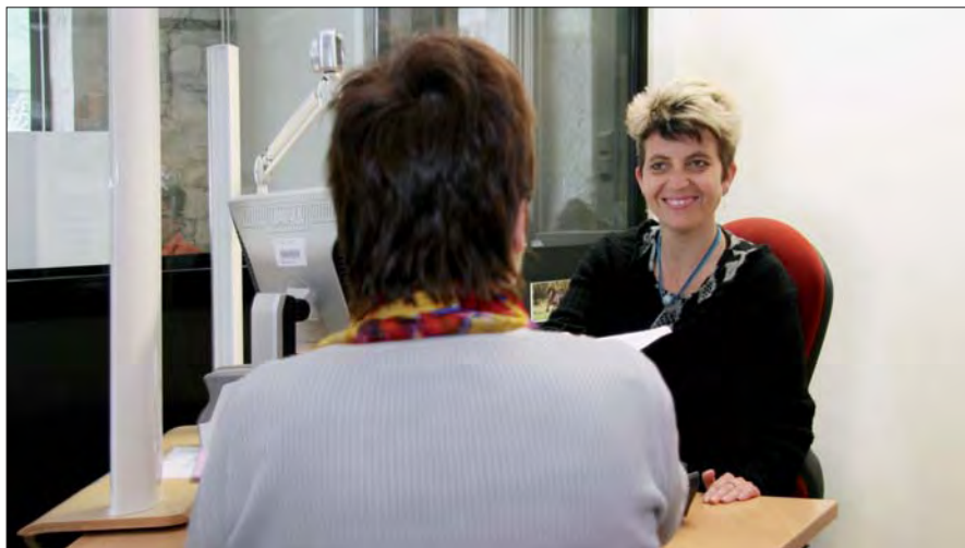
▲ Les nouvelles technologies au service de l'état civil

La demande de passeport se fera uniquement auprès des mairies dotées de stations biométriques composées d'un scanner, de dispositifs de prise de photographies et d'empreintes digitales. Sur l'agglomération grenobloise, vingt-cinq communes sont ainsi équipées. La prise d'empreintes ne concernera plus seulement votre index mais vos huit doigts (les pouces en moins). Toutes les données seront alors saisies sur place et transmises directement, via les stations biométriques, à la préfecture qui réalisera un contrôle en temps réel des pièces fournies. Un récépissé de dépôt de dossier sera alors remis au demandeur. A ce stade, la procédure restera la même : la préfecture transmettra le dossier au centre de traitement de Douai qui fabrique le passeport et l'envoie ensuite par transporteur privé aux mairies. ■