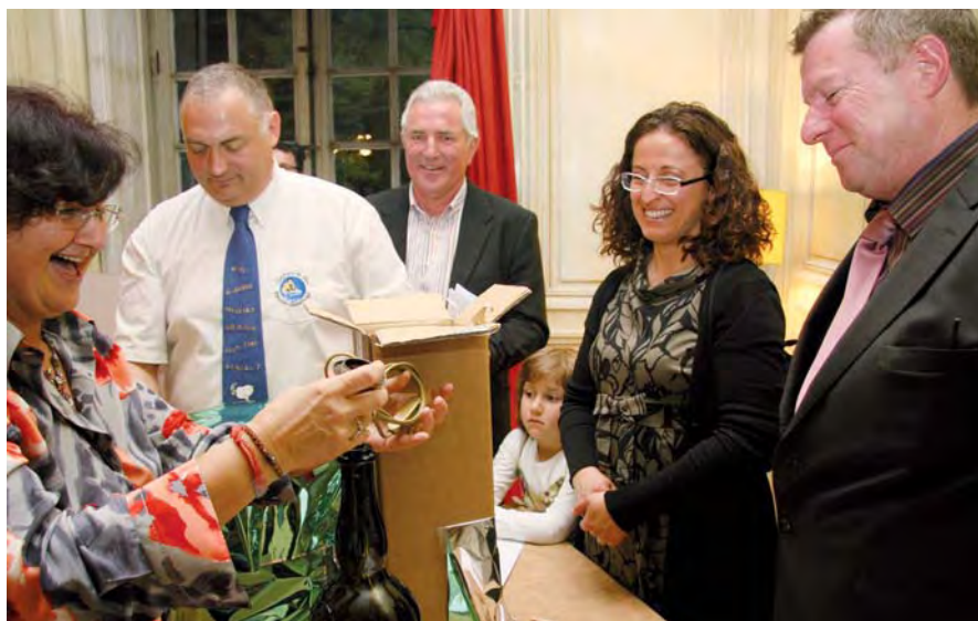
▲ Échange de cadeaux « d'anniversaire »

Apparu après la seconde Guerre mondiale, le jumelage permet de tisser des liens économiques, sociaux et culturels avec plusieurs pays. Un rapprochement que la ville de Sassenage a opéré avec l'Allemagne (Messkirch) et l'Italie (Sasso Marconi).