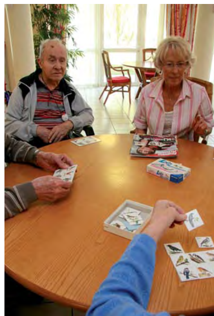
▲ Séance de jeux

E n randonnée le lundi, elle enfourche son vélo le lendemain, et profite même des montagnes avoisinantes et des spectacles du Théâtre en Rond. Mais ce qui lui tient à cœur par dessus tout, c'est l'amour qu'elle porte à la vie des autres, à leur bonheur et leur bien-être.