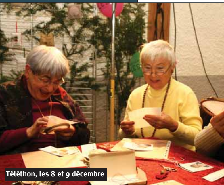
Téléthon, les 8 et 9 décembre