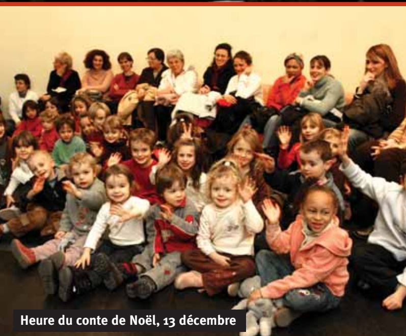
Heure du conte de Noël, 13 décembre