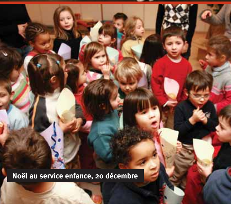
Noël au service enfance, 20 décembre