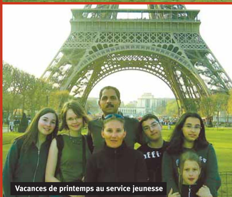
Vacances de printemps au service jeunesse