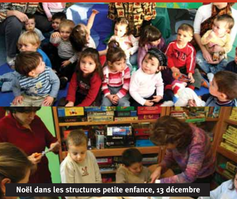
Noël dans les structures petite enfance, 13 décembre