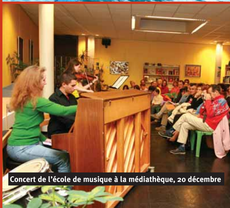
Concert de l'école de musique à la médiathèque, 20 décembre