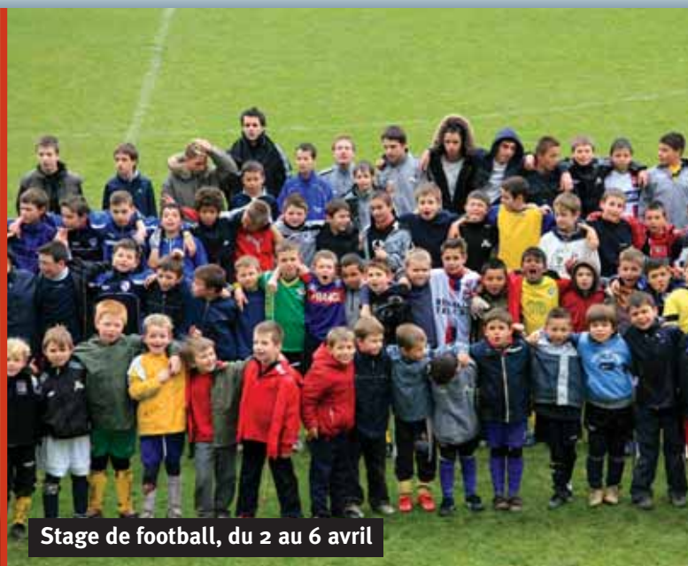
Stage de football, du 2 au 6 avril