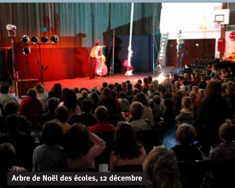
Arbre de Noël des écoles, 12 décembre