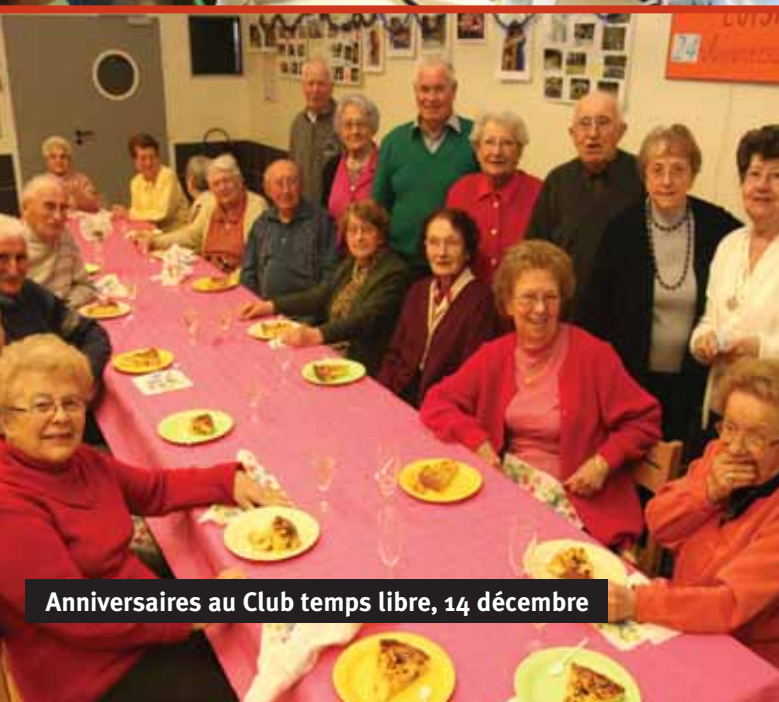
Anniversaires au Club temps libre, 14 décembre