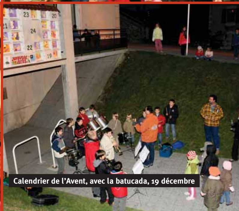
Calendrier de l'Avent, avec la batucada, 19 décembre