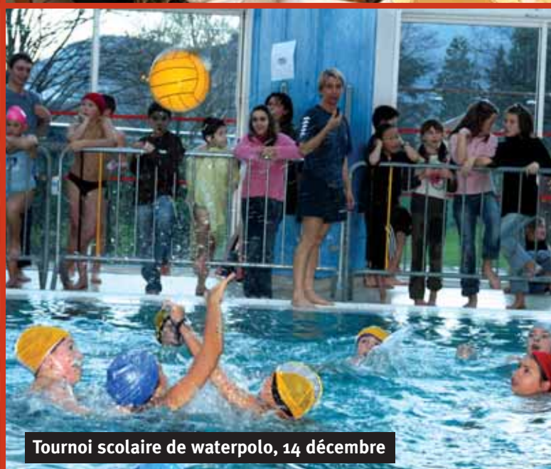
Tournoi scolaire de waterpolo, 14 décembre