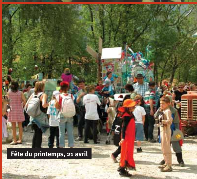
Fête du printemps, 21 avril