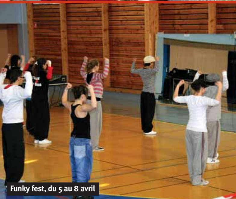
Funky fest, du 5 au 8 avril