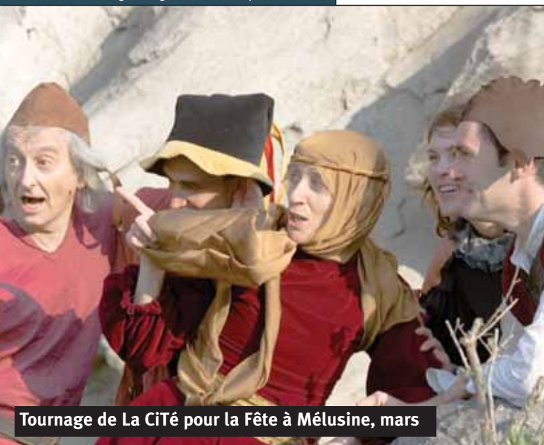
Tournage de La Cité pour la Fête à Mélusine, mars