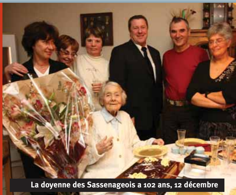
La doyenne des Sassenageois a 102 ans, 12 décembre