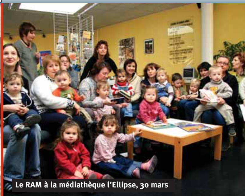
Le RAM à la médiathèque l'Ellipse, 30 mars