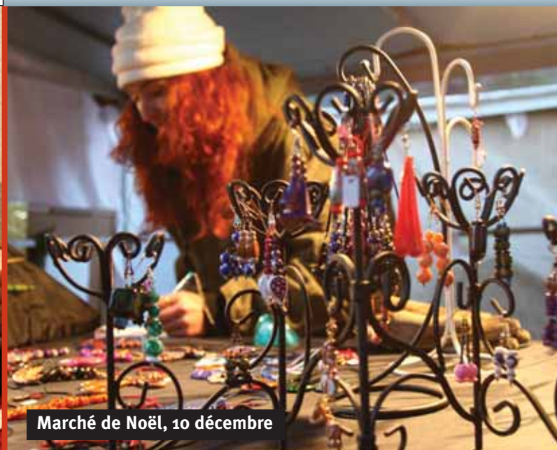
Marché de Noël, 10 décembre