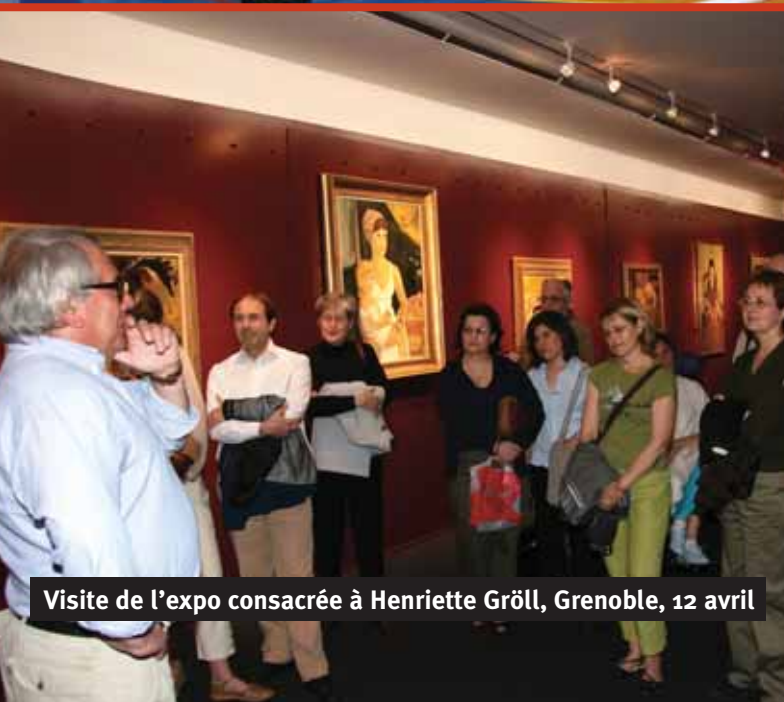
Visite de l'expo consacrée à Henriette Gröll, Grenoble, 12 avril