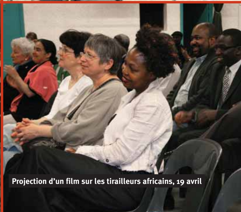
Projection d'un film sur les tirailleurs africains, 19 avril