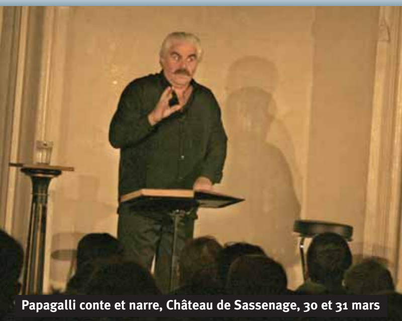
Papagalli conte et narre, Château de Sassenage, 30 et 31 mars