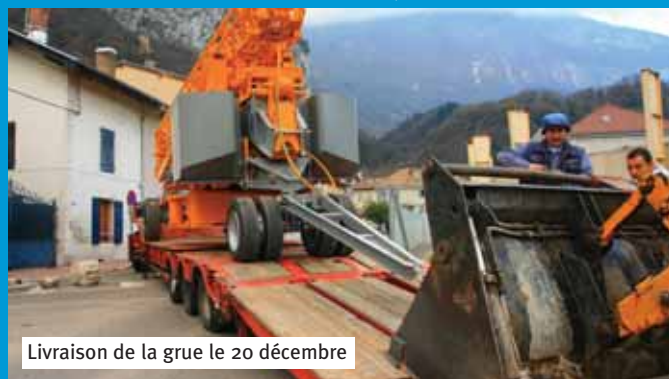
Livraison de la grue le 20 décembre

Gros œuvre jusqu'en avril et charpente dans la foulée pour être hors d'eau pour l'été 2007 et entamer ainsi les aménagements intérieurs courant juillet.