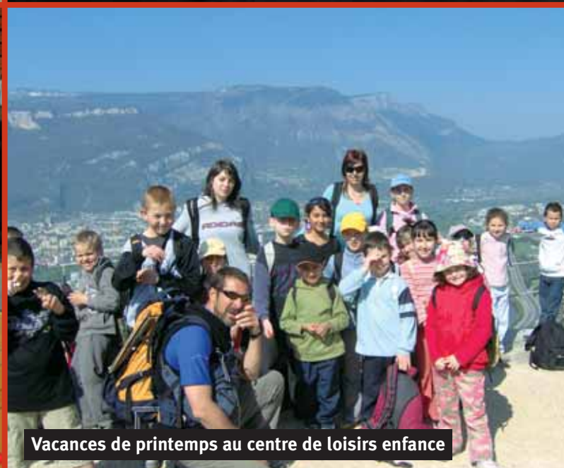
Vacances de printemps au centre de loisirs enfance