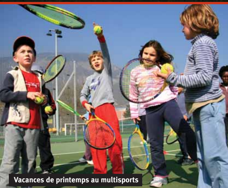
Vacances de printemps au multisports