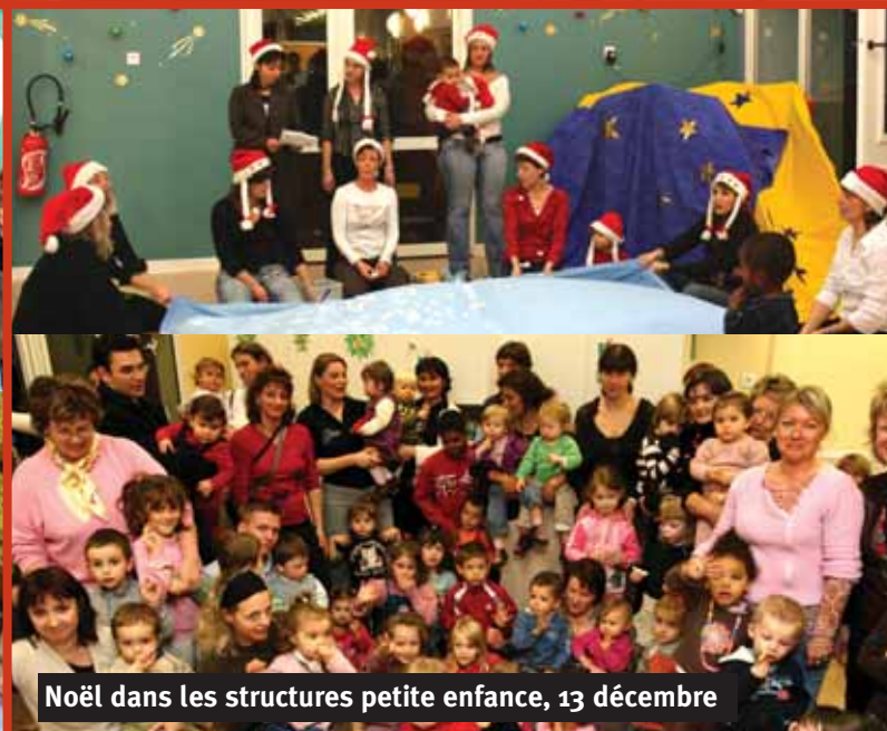
Noël dans les structures petite enfance, 13 décembre