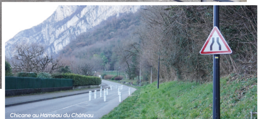
Chicane au Hameau du Château