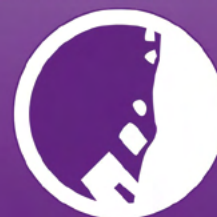
GLISSEMENT DE TERRAIN