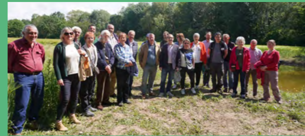
Inauguration du sentier des Engenières, mai 2023

La réalisation du sentier pédagogique des Engenières et les matinées de nettoyage sont des actions de sensibilisation qui visent à accompagner chaque citoyen à travers ces évolutions.