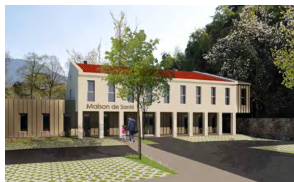
LA MAISON DE SANTÉ

Une piste de pumptrack verra également le jour prochainement, de quoi régaler tous les aficionados de glisse, petits et grands.