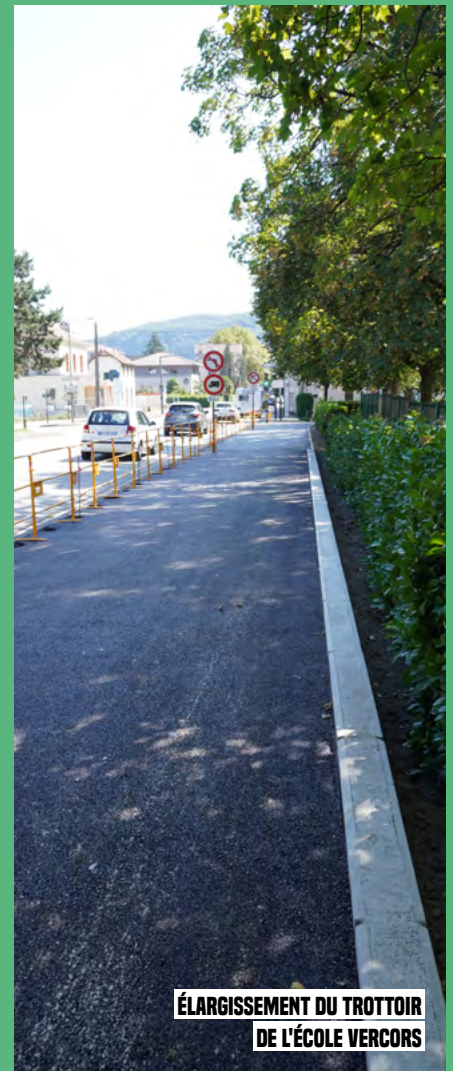
Élargissement du trottoir de l'école Vercors

Il convient de souligner l'implication des jobs d'été et des emplois jeunes quant à la réalisation de ces projets. Ces derniers ont repeint les locaux de l'école élémentaire Vercors ainsi que ceux de la Malle Poste. Ils ont également assuré le désherbage de l'ensemble des cimetières de la commune, une tâche de longue haleine qui contribue grandement à la qualité du recueillement pour tous.