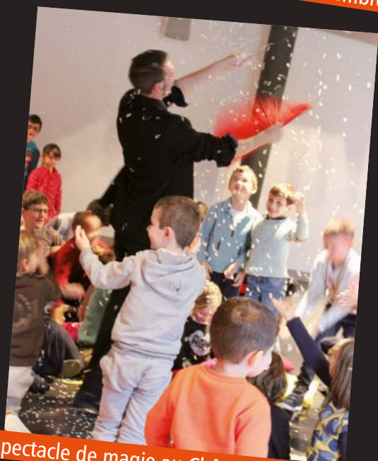
Spectacle de magie au Château, 5 décembre