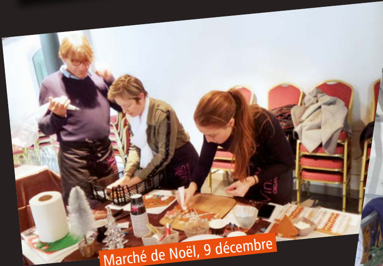
Marché de Noël, 9 décembre