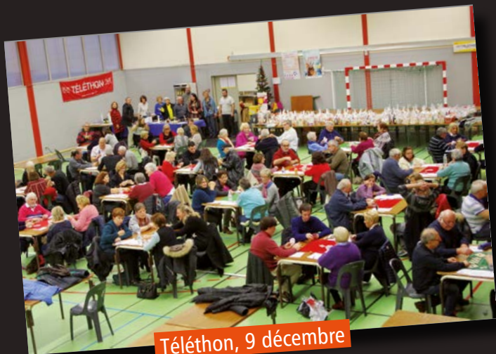
Téléthon, 9 décembre