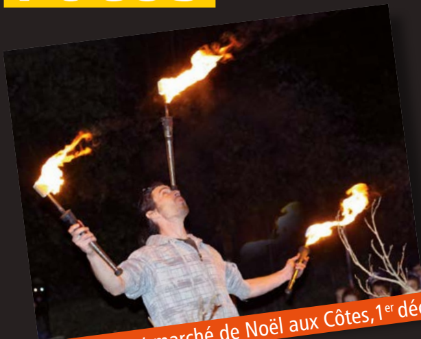
Fête des lumières et marché de Noël aux Côtes, 1 er décembre