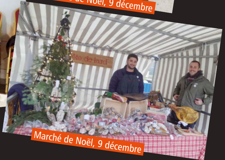
Marché de Noël, 9 décembre