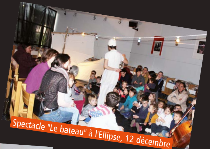
Spectacle "Le bateau" à l'Ellipse, 12 décembre