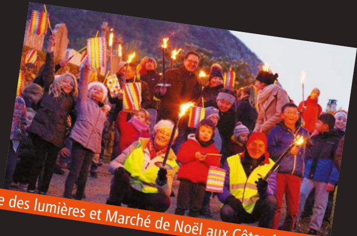
Fête des lumières et Marché de Noël aux Côtes, 1 er décembre