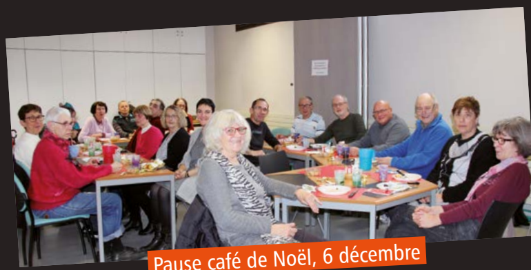
Pause café de Noël, 6 décembre