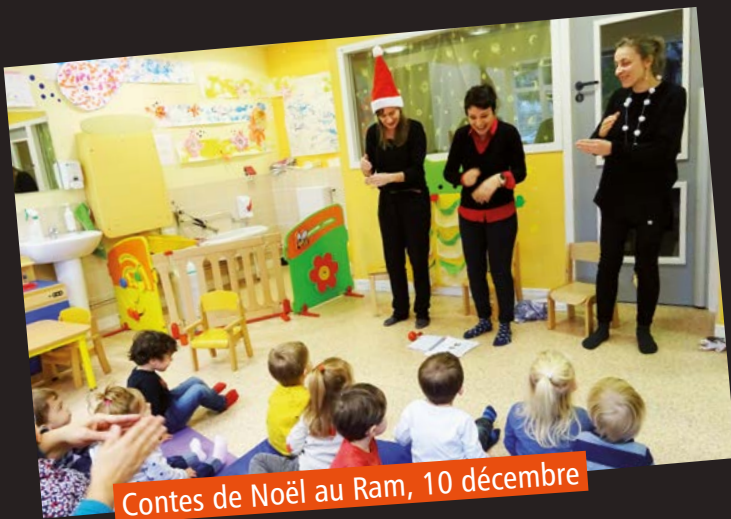
Contes de Noël au Ram, 10 décembre