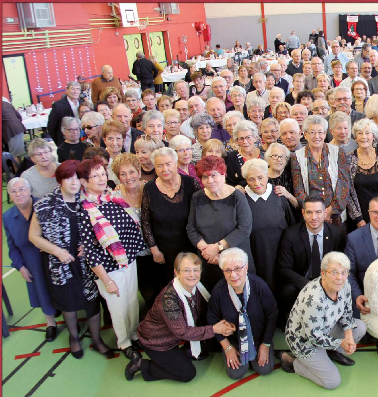
Souvenir du repas de Noël des se