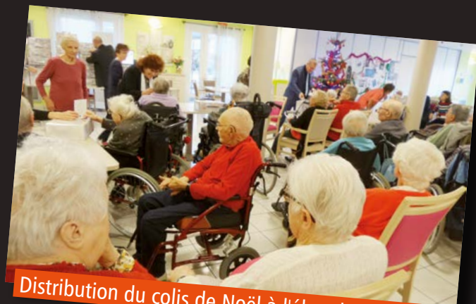
Distribution du colis de Noël à l'éhpad, 7 décembre