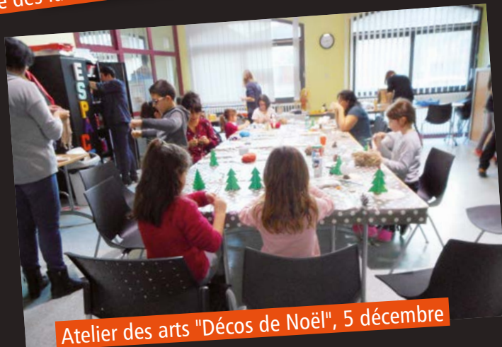
Atelier des arts "Décos de Noël", 5 décembre