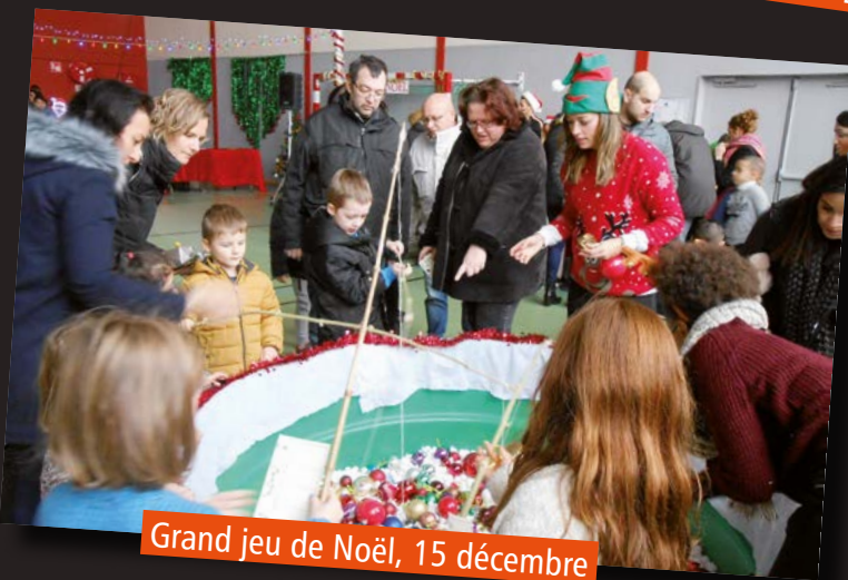
Grand jeu de Noël, 15 décembre