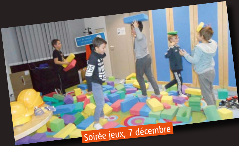
Soirée jeux, 7 décembre