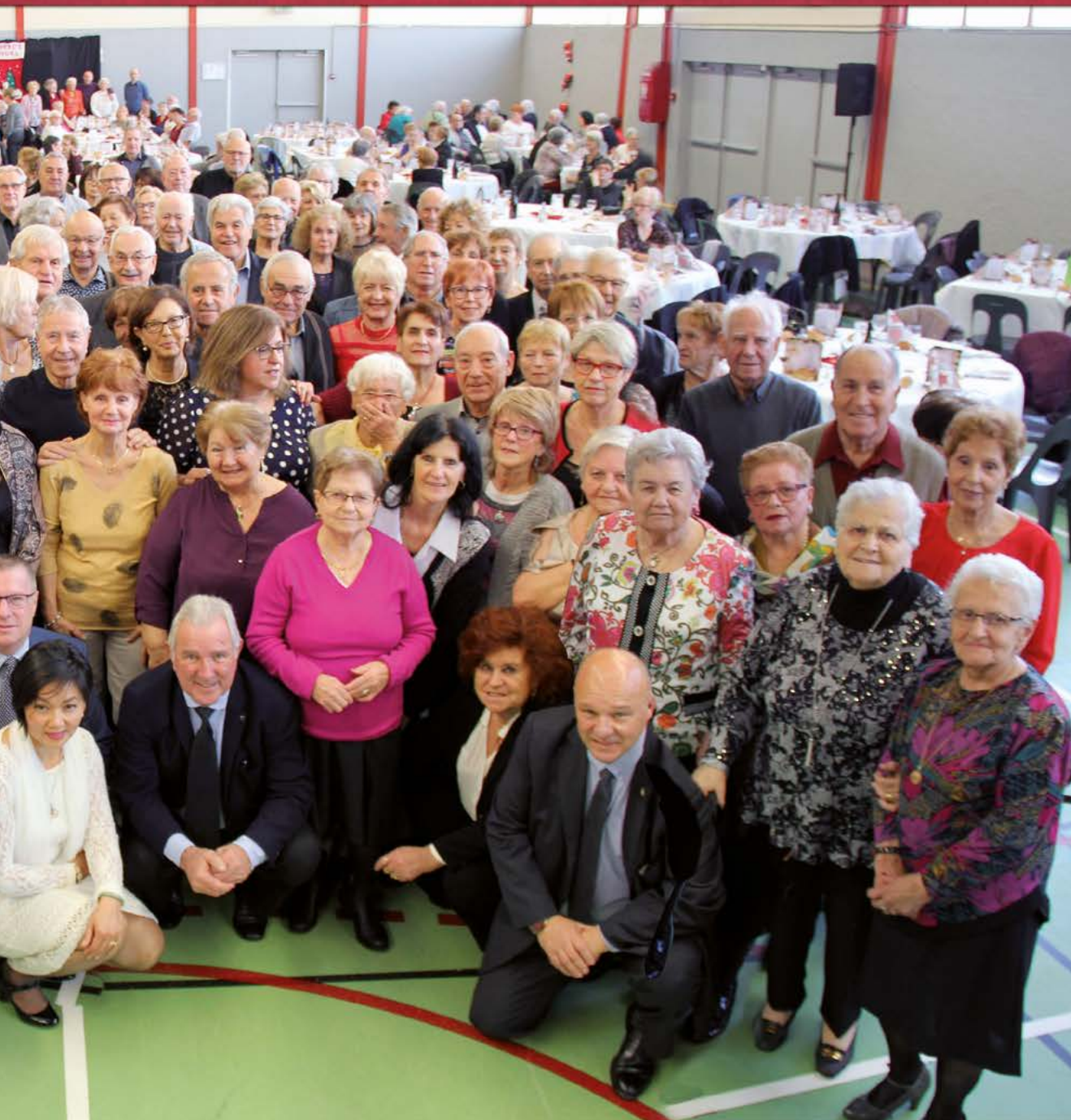
Seniors, mercredi 5 décembre 2018