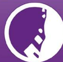
GLISSEMENT DE TERRAIN