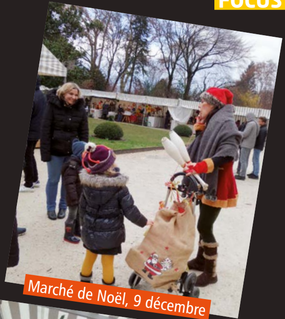
Marché de Noël, 9 décembre