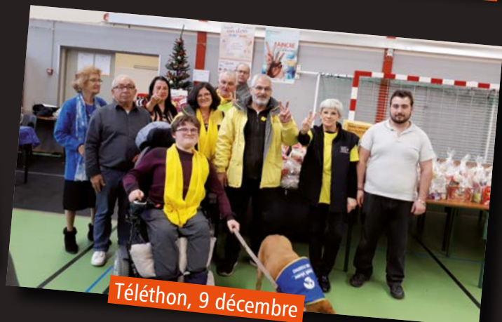
Téléthon, 9 décembre